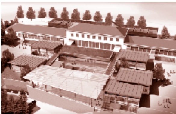
Projet lauréat de l'équipe Tectoniques

Le budget travaux est estimé à 4116000 € TTC pour environ 900m 2 à réhabiliter et 1300m 2 de surface utile à construire en 2 phases de travaux, l'école devant fonctionner sans interruption. TS