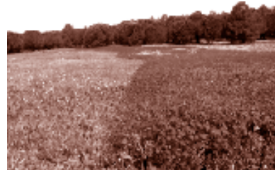
Prairie fleurie de lin rouge, domaine public de Grammont.

Depuis les années 90, des touches de nature sauvage émaillent progressivement les jardins historiques et contemporains. Barcelone reconstruit des morceaux de garrigue et de friche portuaire dans son centre-ville; l'île Saint-Germain à Paris offre des installations champêtres au pied des tours habitées, Strasbourg choisit des mauvaises herbes pour garnir ses voies de tramway, Montpellier sème des champs d'espèces messicoles pour la Coupe du Monde de football.