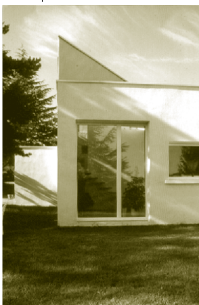
Maison individuelle à Lozanne. Architecte : T. Coquet.

Véritables métastases urbaines, les maisons de «pavillonniers» prolifèrent à la périphérie de nos villes. Ces maisons dites traditionnelles sont censées faire référence à l'architecture de nos régions. Tentant d'imiter notre patrimoine ancien -souvent par un formalisme prétentieux- elles n'en sont en réalité qu'une mauvaise interprétation. En effet, le plus souvent, la «maison néo-régionale» transgresse les caractéristiques de l'architecture traditionnelle (toiture à deux pentes, couverture en tuiles, fenêtres à proportion verticale, volets à la française...) et répond à sa propre typologie (arcades, colonnes, frontons, tuiles provençales...). D'autre part, elle se plie aux contraintes économiques en utilisant des techniques industrielles et des matériaux préfabriqués (parpaings, crépis écrasé,