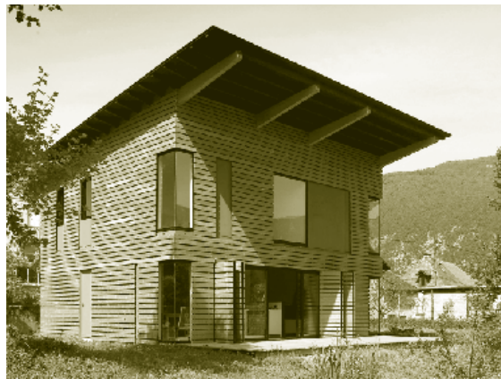
Maison à Novalaise, Savoie. Architectes Tectoriques.