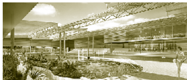
Projet de l'Agence BVL

La ville de Décines qui exploite déjà deux piscines a inscrit ce nouveau programme dans le cadre d'une démarche HQE affirmant ainsi sa volonté de raisonner en «coût global» (notion se retrouvant dans la hiérarchie des cibles HQE et regroupant à la fois les notions de coût d'exploitation et de maintenance).