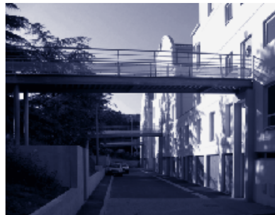
L'habitat intermédiaire : une réponse architecturale en faveur de la mixité urbaine. 37 Logements Locatifs Intermédiaires dans le quartier de la Darnaise à Vénissieux. Architecte : Didier-Noël Petit - 2002.

Il apparaît de façon évidente que les successives crises économiques ont contribué à cette lente mais constante dégradation. Celles de l'emploi induites par l'économie déficiente ont généré des activités dites parallèles et délictueuses qui accentuent encore plus le phénomène de rejet.