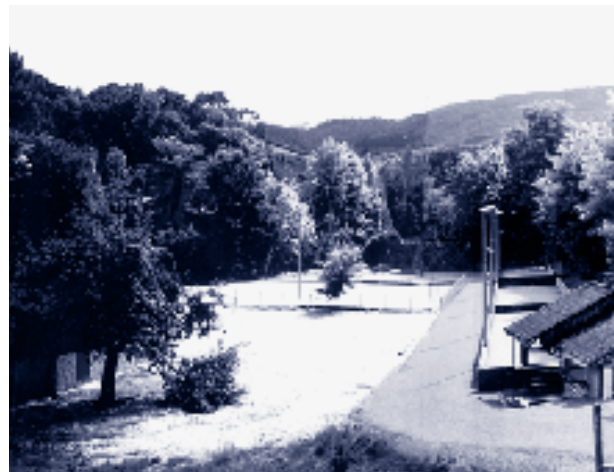
Le site de loisirs en bordure de l'Azergues

La commune de Chamelet a demandé au CAUE du Rhône d'étudier la possibilité de déplacer deux courts de tennis, près d'une zone de loisirs existante en bordure de l'Azergues (jeux de boules, aire de pique-nique et de détente) dans un site végétalisé proche du village. La mission dresse les contraintes du site, formule des hypothèses d'implantation, met en valeur ses atouts qui peuvent donner lieu à une véritable requalification paysagère d'espaces publics dans le cadre d'un projet d'ensemble de valorisation touristique. CLD