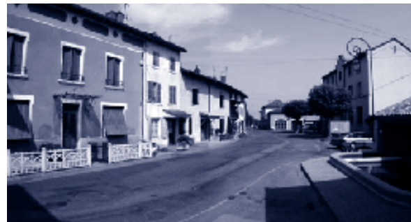
Le centre de Charentay: la mairie et le travail

Charentay, commune rurale du Beaujolais, a acquis récemment quelques bâtiments désaffectés en bordure de la départementale traversant le centre bourg. La municipalité qui s'est lancée dans la mise à jour de son Plan Local d'Urbanisme (PLU), souhaite développer l'offre de logements en petit immeuble collectif sur la commune. Soucieuse de la qualité de son environnement de vie, elle fait appel au CAUE pour l'aider à définir des objectifs pour l'insertion architecturale des nouveaux logements. Le conseil conduit à définir les grands traits identitaires du paysage, via un diagnostic sur le centre bourg : - une localisation originale, entre plaine de la Saône et contreforts du Mont Brouilly. Le paysage très lisible se définit par des lignes d'horizon basses et hautes, des lumières variées dans la journée, des contrastes de campagne... - une structure de bourg en étoile, à la croisée de routes qui deviennent contraignantes en terme de flux véhiculaires. Des ruptures de continuités dans les formes et les usages viennent perturber la lecture d'un centre bourg par ailleurs cohérent.