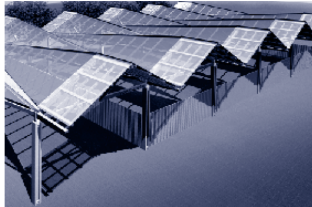
Projet de l'équipe Tectoniques

composée d'un architecte, d'un paysagiste et d'un plasticien. Trois équipes étaient admises à concourir pour ce projet : NOVAE, TECTONIKES et ATELIER DE L'ENTRE. L'équipe TECTONIKES, lauréate du concours lancé par la ville de Tarare, est apparue très cohérente dans sa composition mettant en évidence une réelle complémentarité des compétences (paysagère - architecturale - plasticienne). La pertinence du projet s'est manifestée par la bonne prise en compte de la problématique liée aux liaisons et cheminements urbains mais également par une démarche associée aux préoccupations environnementales et écologiques actuelles (dans la conception même ainsi que dans le choix des matériaux).