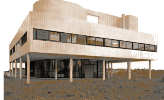
Villa Savoye. Le Corbusier

Le mythe de la première maison, selon Joseph Rykwert (1), serait celui d'Adam, chassé du paradis, qui joint les mains au-dessus de sa tête pour se protéger de pluies diluviennes. La maison serait née d'un geste qui aurait déterminé son anthropomorphisme récurrent, celui du besoin de protection contre les éléments extérieurs. La maison, comme la cité ou le temple, est au centre du monde, elle est l'image de l'univers. La maison traditionnelle chinoise est carrée ; elle s'ouvre au soleil levant, le maître s'y tient face au sud, comme l'Empereur dans son palais ; l'implantation centrale de la construction s'effectue selon les règles de la géomancie. Le toit est percé d'un trou pour la fumée, le sol d'un trou pour recueillir l'eau de pluie : la maison est ainsi traversée en son centre par l'axe qui joint les trois mondes. La yourte mongole est ronde, en relation avec le nomadisme, car le carré orienté implique la fixation spatiale ; le mât central, ou seulement la couronne de fumée, y coïncide avec l'Axe du monde.