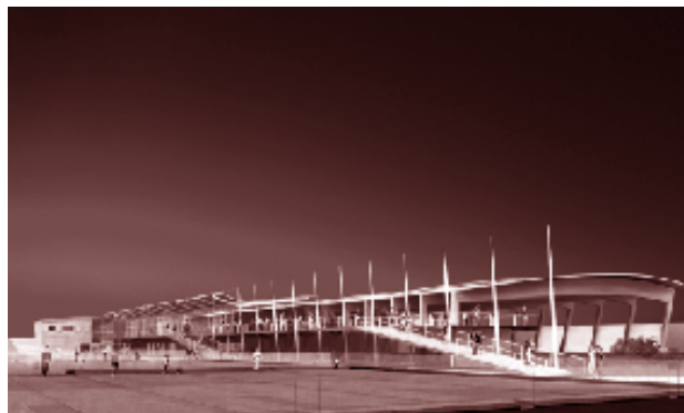
Projet de l'équipe lauréate, l'agence Chabanne

L'agence Chabanne lauréate du concours lancé par le Conseil Général du Rhône, est celle qui a su gérer au mieux les différentes problématiques architecturales et urbaines inhérentes au programme: entrée nord de la ville de Lyon par l'autoroute A6, configuration «en triangle» de la parcelle, proximité physique (sonore et visuelle) de l'autoroute A6, gestion complexe des chemins et accès, et apporter une réponse adaptée.