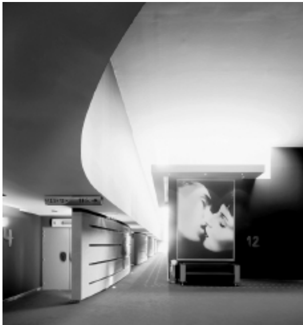
Complexe cinématographique PATHE Valence (12 salles - 2350 fauteuils). Architecte : Atelier A - Claude Chautan. Investisseur : Groupe Pathé - Montage : CIRPAD Grand Sud. Réalisation : GFC Construction.

« Ma spécialité est la photographie d'architecture (mes études s'inscrivaient dans ce domaine). Je recherche de plus en plus à montrer la sensibilité de mes sujets, en architecture bien sûr, ainsi que dans les photographies sur les métiers et surtout dans mes portraits ». Renaud Araud, photographe.