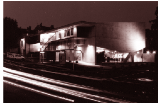
Cinéma de Tarare. Architectes : Marie et François Delhay. Architecte associé : Laurent Béchetolle.

Reste que l'évolution de l'offre cinématographique entraîne des mutations urbaines importantes. Après une période de démarrage, d'évaluation, les enjeux urbains et architecturaux sont de mieux en mieux perçus par les opérateurs et l'on voit des programmes de multiplexes devenir pièce constituante de projets urbains majeurs pour le développement des villes. Outre la spécificité du programme et l'affirmation de l'image de marque de l'opérateur, l'architecture du multiplexe rend alors compte de la situation urbaine, des enjeux du site et devient un élément structurant du