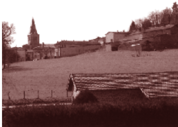
Site de la future salle multimédia à Saint-Clément

A l'issue de la phase de négociation l'architecte Yves Moutton s'est vu confier la mission de maîtrise d'œuvre. C.L.D.