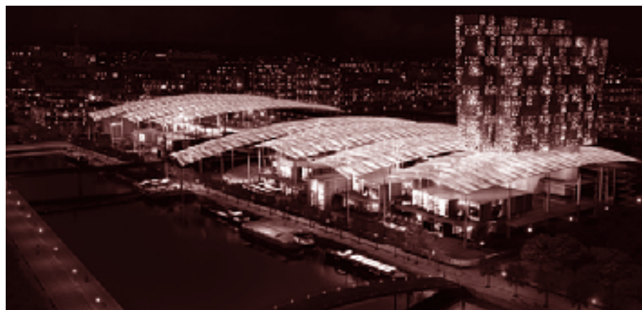
Lyon-Confluence, pôle de loisirs. Projet retenu. Architecte: Jean-Paul Viguier. Il est prévu notamment un cinéma multiplexe de 14 salles pour 3400 places.

Quand elle ne disparaissait pas, la vieille salle de cinéma, bien placée et assez spatieuse se voyait transformée en complexe de 2 à 8 salles environ. Et quand cette mutation fut opérée, il fallut bien sortir de la ville (ou la précéder). C'est alors qu'apparut dans la dernière décade du XX e siècle, le multiplexe.