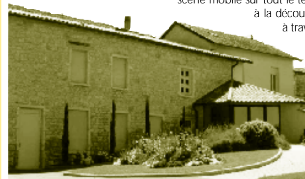
Théâtre de Gleizé