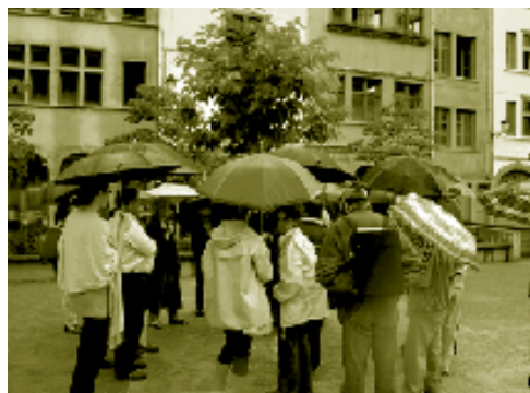
Les habitants se « mouillent » dans les projets urbains. Visite commentée par le maître d'ouvrage et le maître d'œuvre de la place du Bâtonnier Valansio.